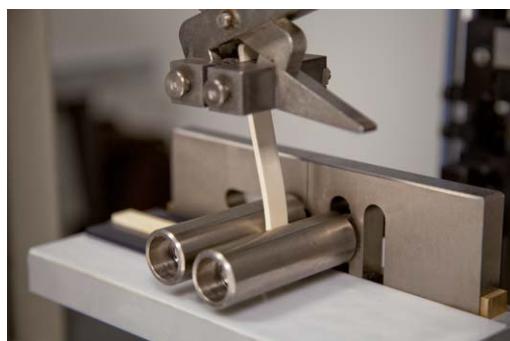
Dinamometro che misura la forza necessaria a separare il materiale morbido sovrastampato su un materiale rigido Dynamometer measuring the force necessary to separate a soft material overmoulded on a rigid material